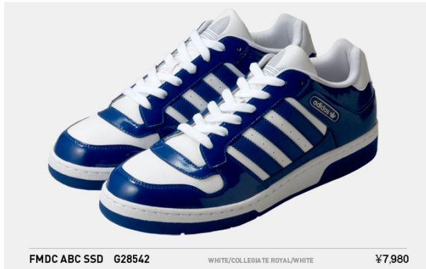
FMDC ABC SSD G28542 WHITE/COLLEGIATE ROYAL/WHITE ¥7,980