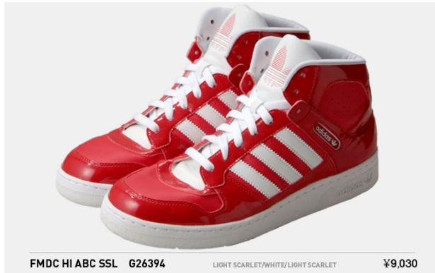
FMDC HI ABC SSL G26394 LIGHT SCARLET/WHITE/LIGHT SCARLET ¥9,030