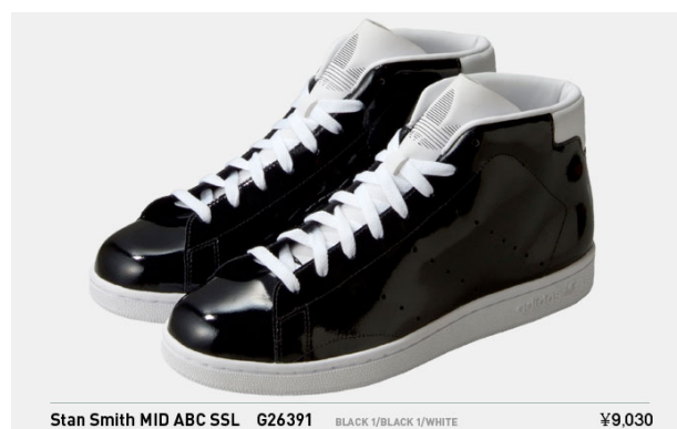
Stan Smith MID ABC SSL G26391 税込¥9,030-