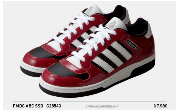
FMDC ABC SSD G28543 CARDINAL/WHITE/BLACK 1 ¥7,980