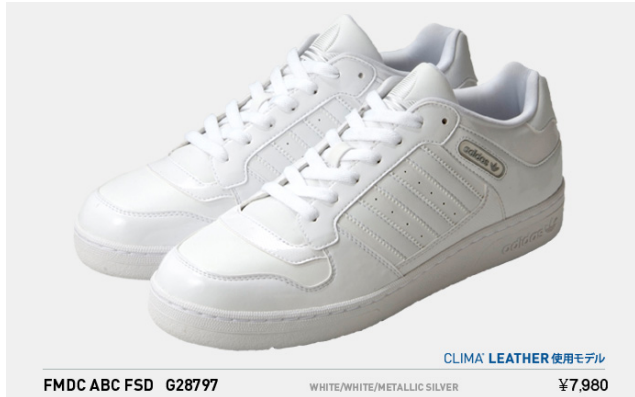
FMDC ABC FSD G28797 税込¥7,980- (※クライマレザー使用モデル)