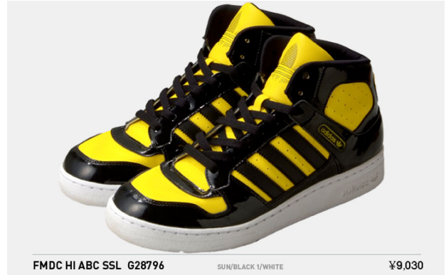
FMDC HI ABC SSL G28796 SUN/BLACK 1/WHITE ¥9,030