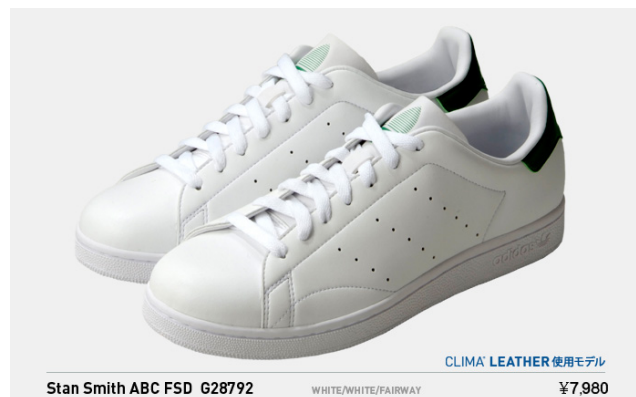
Stan Smith ABC FSD G28792 税込¥7,980- (※クライマレザー使用モデル)