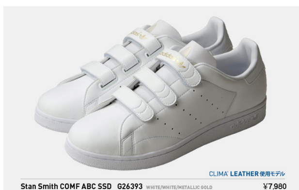
Stan Smith COMF ABC SSD G26393 税込¥7,980- (※クライマレザー使用モデル)