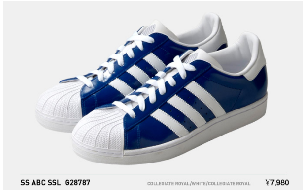
SS ABC SSL G28787 COLLEGIATE ROYAL/WHITE/COLLEGIATE ROYAL ¥7,980