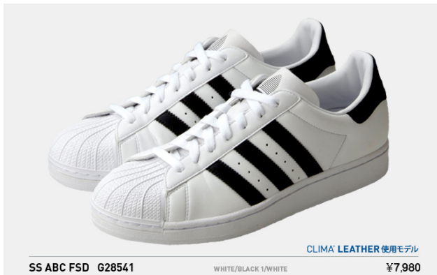
SS ABC FSD G28541 税込¥7,980- (※クライマレザー使用モデル)