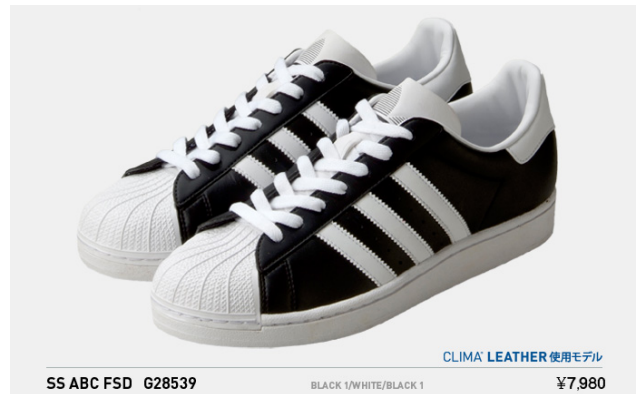
SS ABC FSD G28539 税込¥7,980- (※クライマレザー使用モデル)