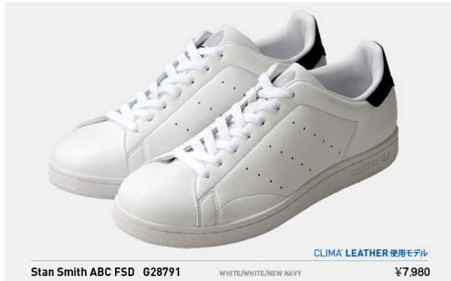
Stan Smith ABC FSD G28791 税込¥7,980- (※クライマレザー使用モデル)