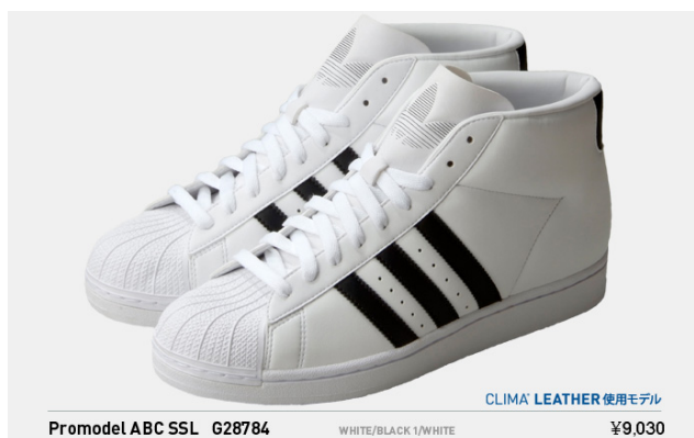
Promodel ABC SSL G28784 税込¥9,030- (※クライマレザー使用モデル)