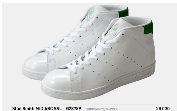
Stan Smith MID ABC SSL G28789 税込¥9,030-