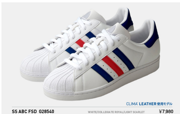
SS ABC FSD G28540 税込¥7,980- (※クライマレザー使用モデル)