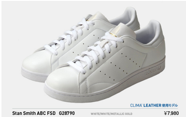
Stan Smith ABC FSD G28790 税込¥7,980- (※クライマレザー使用モデル)