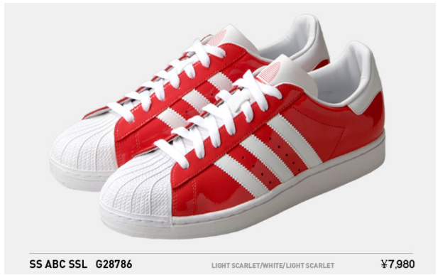
SS ABC SSL G28786 LIGHT SCARLET/WHITE/LIGHT SCARLET ¥7,980