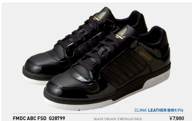
FMDC ABC FSD G28799 税込¥7,980- (※クライマレザー使用モデル)