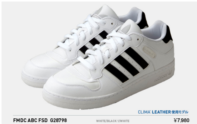
FMDC ABC FSD G28798 税込¥7,980- (※クライマレザー使用モデル)