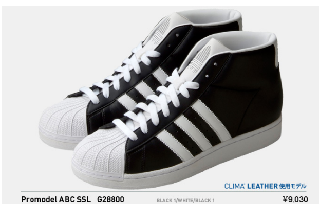
Promodel ABC SSL G28800 税込¥9,030- (※クライマレザー使用モデル)