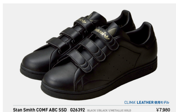
Stan Smith COMF ABC SSD G26392 税込¥7,980- (※クライマレザー使用モデル)