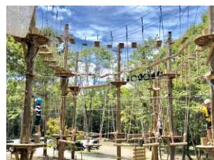
ツリークライミング 小さなお子様も楽しめる 本格的なツリークライミング