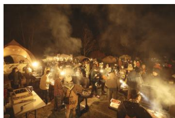
ふるまいBBQ 毎年大好評 DANNER CAMP名物企画