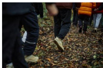
トレッキング DANNERのトレイルモデル "TRAIL 2650 GTX"をお貸出し