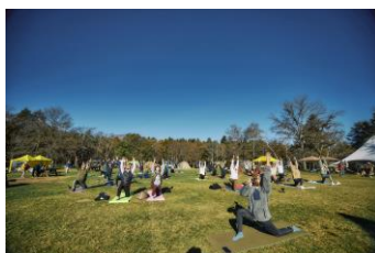
森の中の深呼吸、朝のヨガ体験 一日の始まりを元気にスタート！