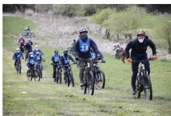
タンデムスタイルによる 2輪と触れ合おうコーナー バイク、電動バイク、 電動アシスト自転車の 展示・試乗を実施