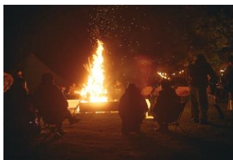
CAMPFIRE キャンプの醍醐味 心地よい軽井沢の秋の夜を