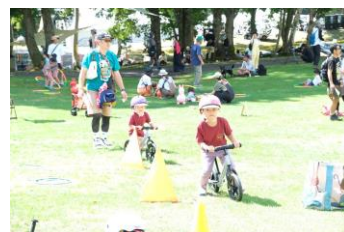
バランスバイク バランスバイクに乗って大 自然を感じながらスタンプラリー を完成させよう！！