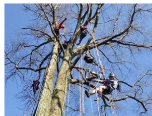
スカイアスレチック 「アウルアドベンチャー」 子供から大人まで楽しめるアスレチック