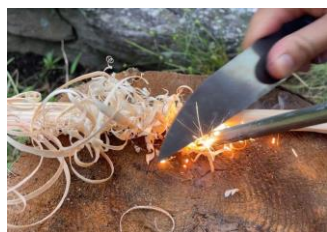
メタルマッチ火起こし ちょっとしたコツでお子様でも 火起こしができるようになる ワークショップ